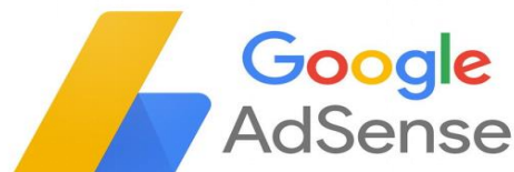
Gambar 1. Google AdSense

AdSense adalah cara mudah tanpa biaya untuk memperoleh penghasilan dengan menampilkan iklan di samping konten online. Dengan AdSense , dapat menampilkan iklan yang menarik dan relevan bagi pengunjung situs, bahkan menyesuaikan tampilan serta nuansa iklan agar sesuai dengan situs Anda.