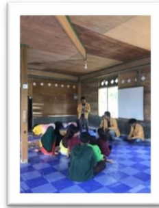
Gambar 5. Pelatihan Tentang Tools dan Template Aplikasi Canva

tools dan template yang ada di canva. Mereka mampu membuat poster-poster seruan kebersihan yang dipandu oleh team.