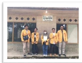
Gambar 1. Survey Lokasi