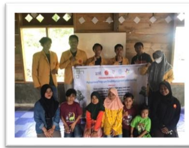
Gambar 5. Foto Perpisahan Dengan Remaja Surau