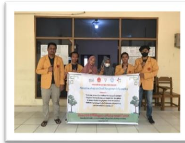
Gambar 2. Pelepasan Team Pengabdian Koto Hilalang

Dengan perjalanan kurang lebih 25 menit dari kota solok, team pun sampai di lokasi pengabdian, kegiatan ini dimulai pukul 11.30 Wib, dengan kegiatan sosialisasi tentang arti penting menjaga kebersihan lingkungan, baik lingkungan aekitar surau ataupun lingkungan diluar surau, kegiatan sosialisasi ini kemudian dilanjutkan dengan aksi nyata berish-bersih di linkungan surau baik dalam surau dan lingkungan sekitar surau.