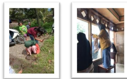
Gambar 4. Aksi Bersih Lingkungan Sekitar Surau

Kegiatan ini diikuti dengan antusias yang luarbiasa oleh remaja surau dan team, canda tawa yang selalu memecah suasana membuat kami yang baru dilingkungan tersebut merasa kami adalah keluarga dari mereka.