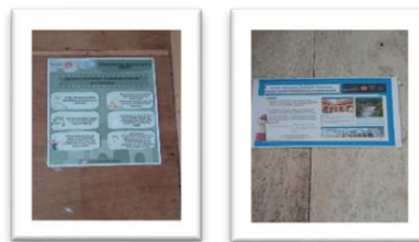
Gambar 3. Spanduk Karya Remaja Surau Dan Team

Antusias remaja surau membuat semangat team mengebu-gebu menyampaikan materi-materi lainnya, dan dengan hasil akhir team mencetakan hasil desain remaja surau dan team, yang kemudian di tempel di dinding untuk informasi himbauan menjaga kebersihan.