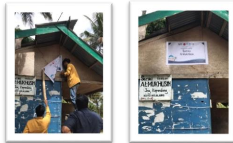
Gambar 4. Pemasangan Spanduk Surau